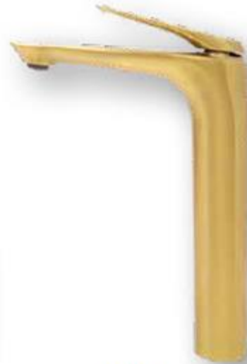
78.0102G Monomando lavabo alto → 46 ↑ 301 ↗ 200 mm