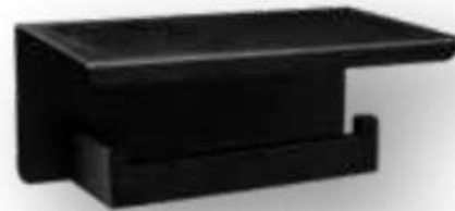
70.09032N Portarrollos con soporte