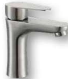
60.0001 Monomando lavabo bajo