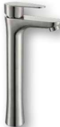
60.0002 Monomando lavabo alto